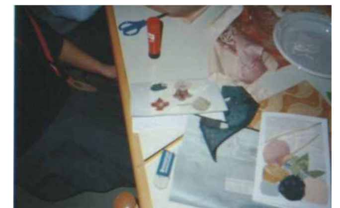
I nostri laboratori

Nel mese di febbraio 2003 sono stati organizzati dalla nostra Sezione Ragazzi altri due divertenti ed originalissimi laboratori creativi, grazie ai quali una cinquantina di bambini hanno potuto realizzare coloratissimi festoni carnevaleschi e graziosi biglietti augurali.