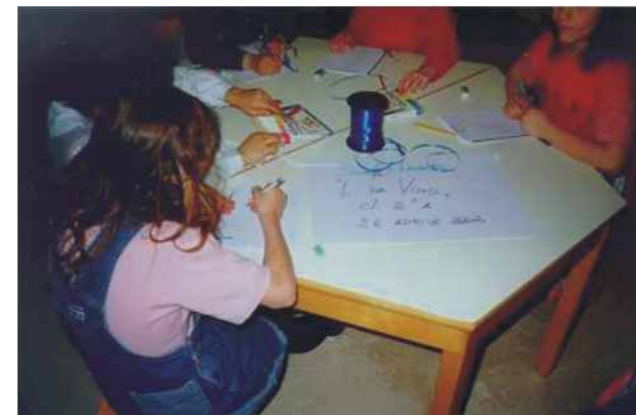
Costruzione di un libretto durante una visita guidata

scolaresche che conducono in loco ricerche ed approfondimenti sugli argomenti svolti in classe, coadiuvati in genere da indicazioni e riferimenti bibliografici forniti dal bibliotecario. Per gli ospiti più piccoli vengono sovente svolte, inoltre, letture animate di fiabe o altre attività finalizzate ad avvicinare il bambino al misterioso e magico mondo dei libri, nel qual caso la visita guidata si conclude col prestito librario!!