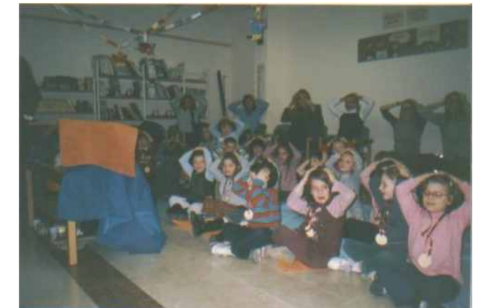
Laboratori di lettura a voce alta con una scolaresca

biblioteca e del libro anche i più piccoli, proponendo loro l'esperienza del leggere in chiave di gioco festoso, nell'ambito della loro più consona e naturale dimensione. I bimbi inoltre erano accompagnati da almeno un genitore, per cui i nostri incontri si sono dimostrati, anche, esperienza importante nell'ottica di condivisione di emozioni tra genitori e figli.