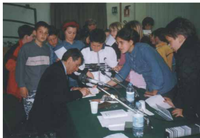
Lorenzo Taffarel incontra le scolaresche

Nel corso dello scorso anno sono stati ospiti della nostra biblioteca anche gli